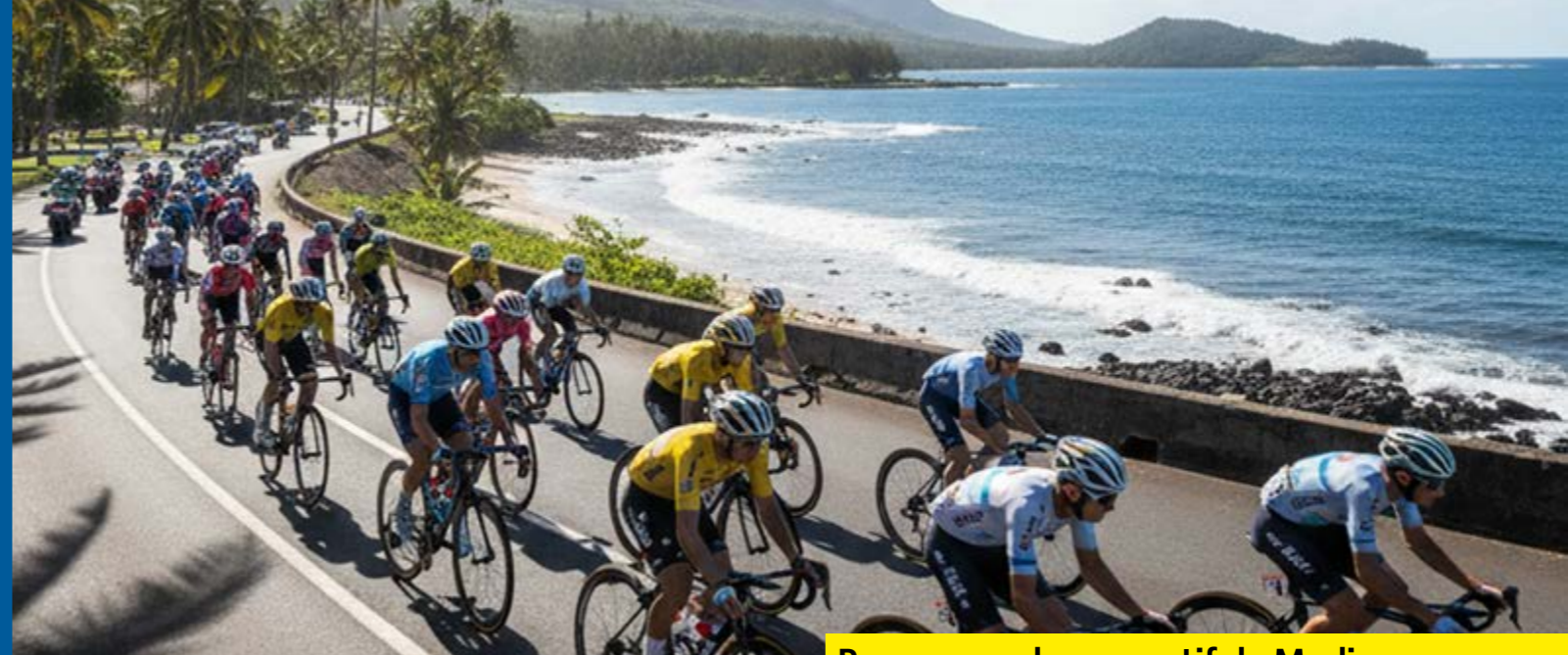
Parc - complexe sportif de Medine